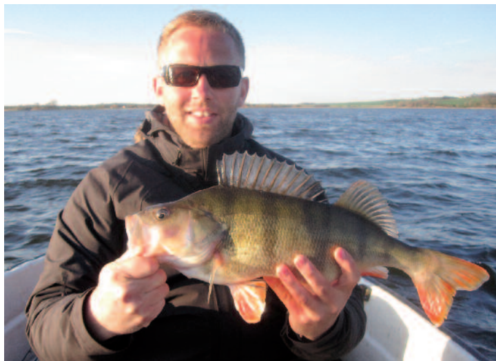
Tissø byder udover store gedder også på en god bestand af pæne aborrer som denne.

DEN SLAGS RYGTER sætter gang i fiskelysten, og vi kører på med kastefiskeriet, som giver et par →