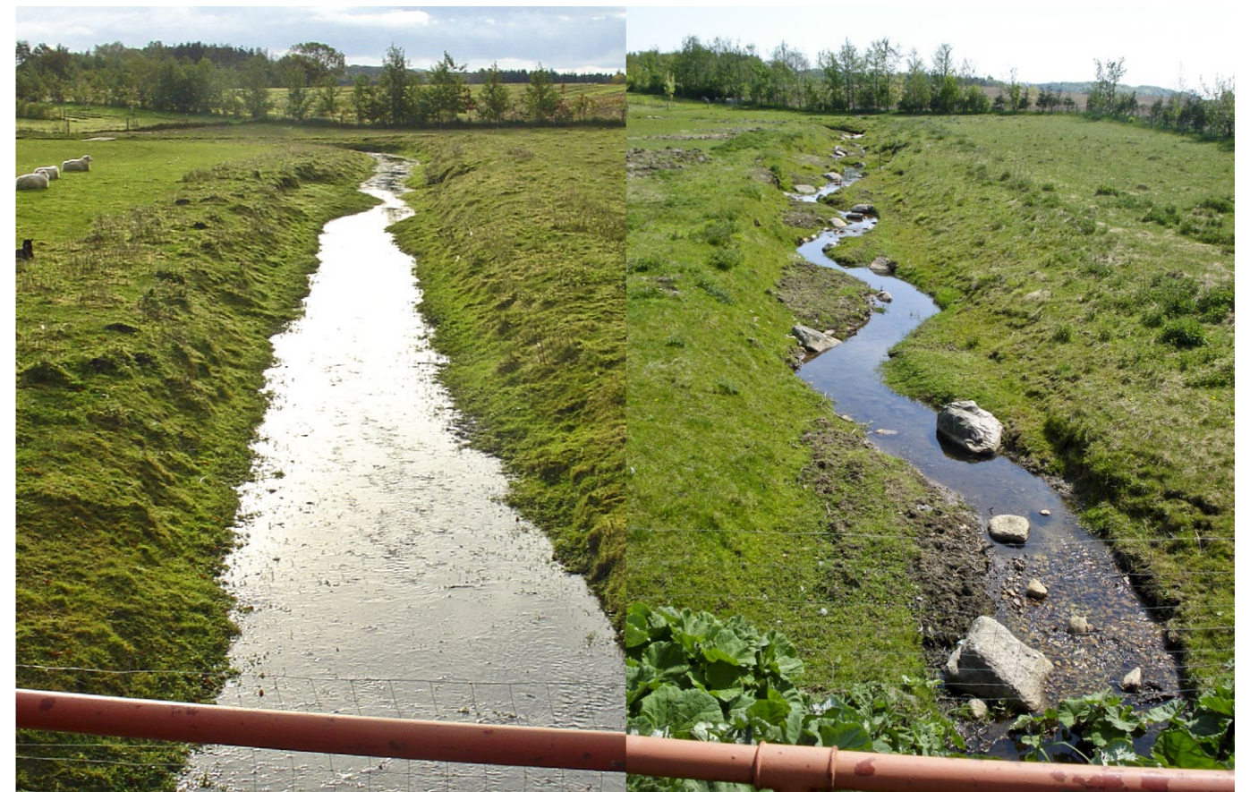
Afvanding og natur. Ved ekstrem nedbør sikres vandføringen ved at have et såkaldt dobbeltprofil, som samtidig også sikrer »det gode vandløb« under normale forhold.