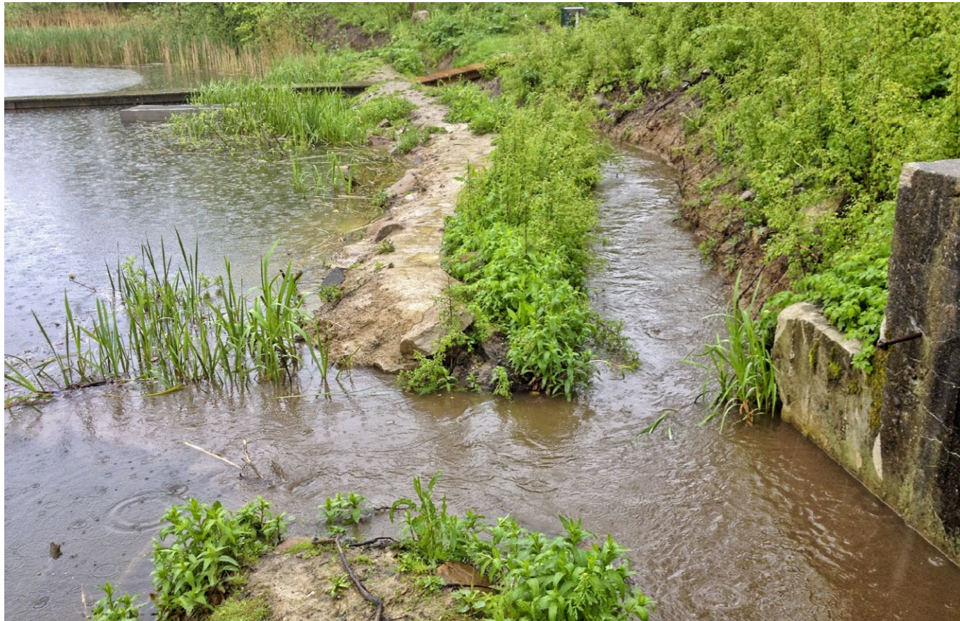
Klimaforandringer. I Vordingborg Kommune tænker man fiskene ind i det store billede. Her er der adgang for aborrerne til et regnvandsbassin, som skal håndtere overfladespildevandet ved ekstrem nedbør, men nu også fungerer som et gydeområde for aborre.

Fishing Zealand er et samarbejde mellem Danmarks Sportsfiskerforbund og en række sjællandske kommuner. Fishing Zealand tog sin spæde begyndelse i 2013 og har på kort tid udviklet sig kraftigt. Fishing Zealand-samarbejdet er værdibaseret og helhedsorienteret. Vordingborg Kommune ser store perspektiver i samarbejdet.