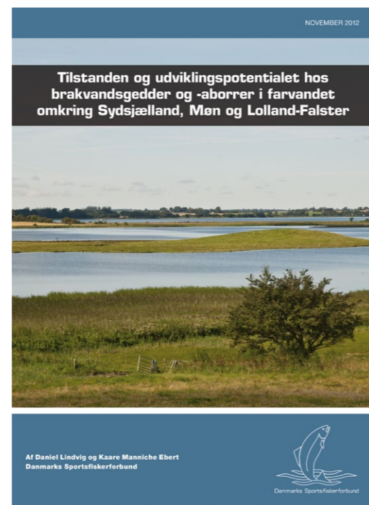
Brakvandsrapport. I 2012 udgav Danmarks Sportsfiskerforbund en rapport om tilstanden og udviklingspotentialet hos rovfiskene i farvandet omkring Sydsjælland, Møn og Lolland-Falster. Læs den på www.sportsfiskeren.dk/brakvandsrapport

En kommune har en mangfoldighed af opgaver. Det gælder også Vordingborg. Ligesom mange andre kommuner er der udfordringer i forhold til