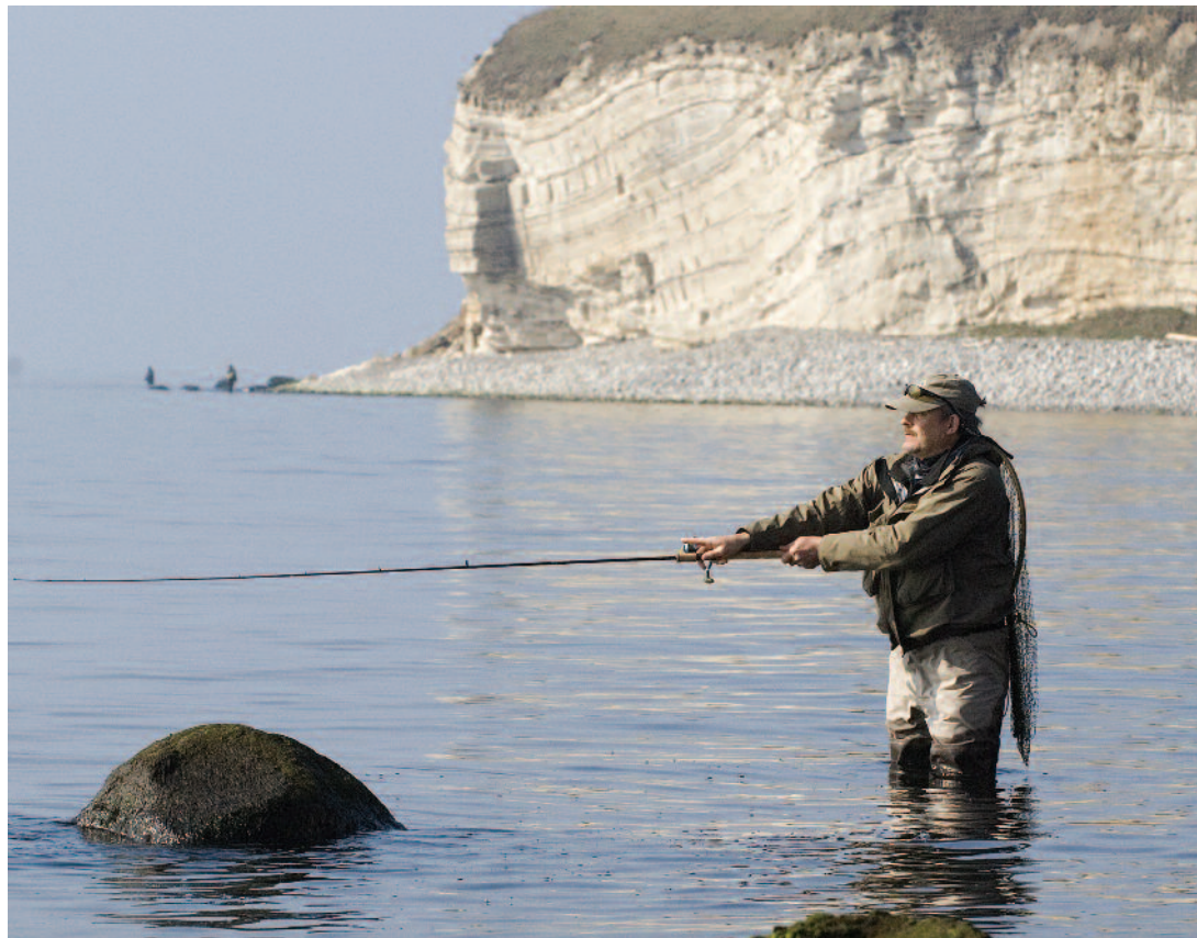
Kystfiskeriet på Stevns har på ingen måde været fantastisk i 2013 – en problematik som Fishing Zealand projektet forhåbentlig kan være med til at rette op på.

Fishing Zealand, der er blevet til på initiativ fra Danmarks Sportsfiskerforbund, har været mange år undervejs, og selvom det ikke har været særligt synligt, er der lagt rigtig meget arbejde i at få stablet projektet på benene. Fra dette efterår tager projektet dog for alvor fat, og første tydelige skridt er projektets nye hjemmeside – www.fishingzealand.dk .